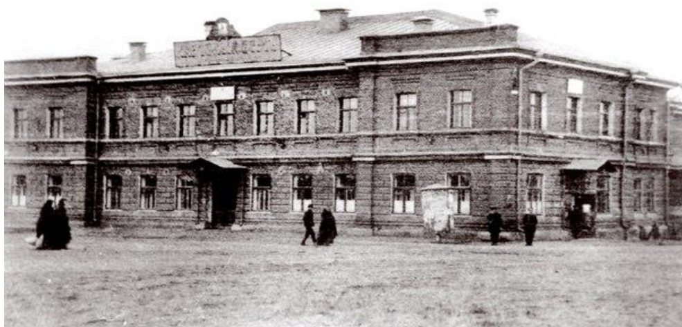
Народный дом на улице Дворянская. 1911г.