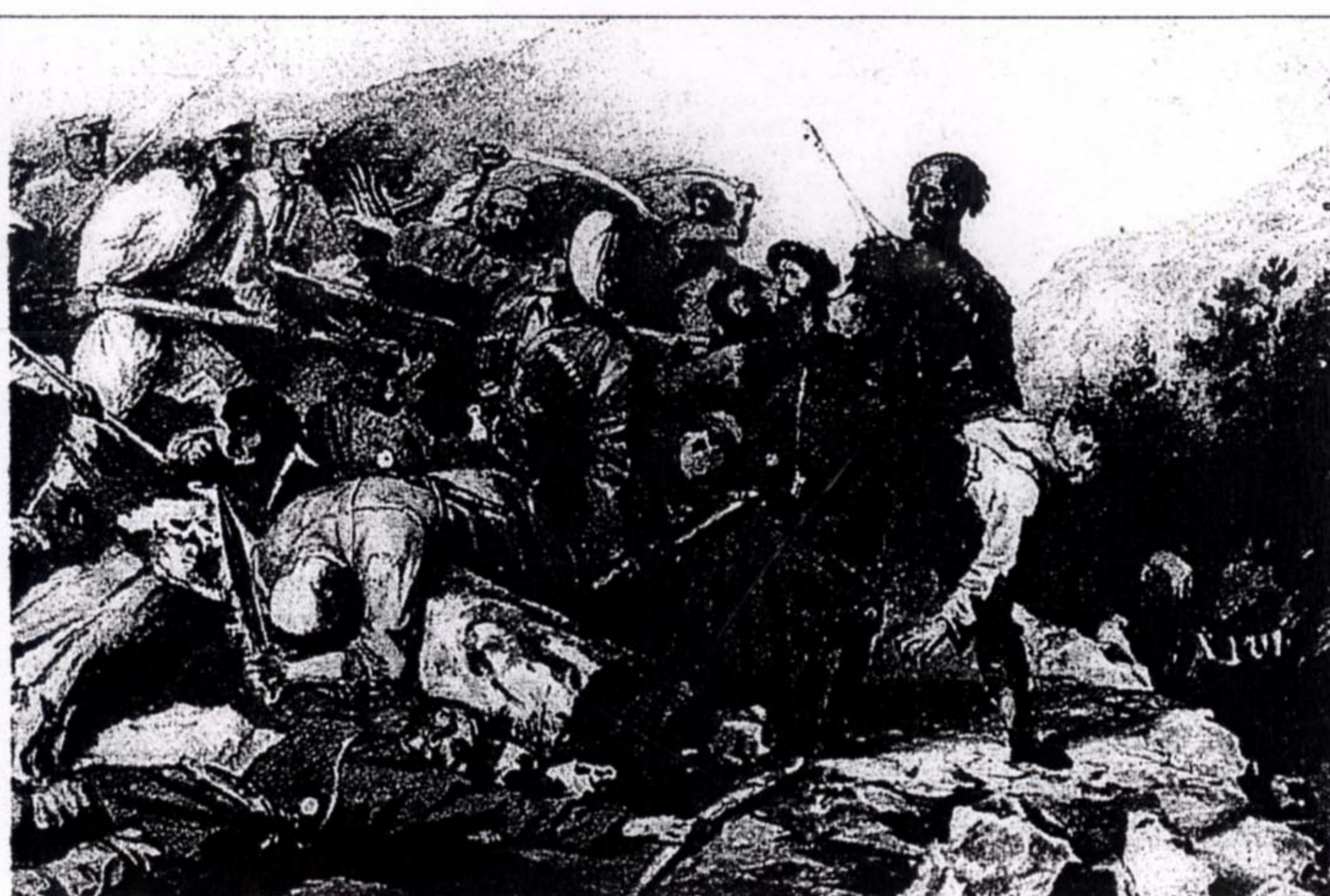
«БИТВА ПРИ ВАЛЕРИКЕ». АКВАРЕЛИ М. Ю. ЛЕРМОНТОВА

задание: сопровождать генерал-лейтенанта А. А. Вельяминова. 10 мая в Гулабийском лесу состоялся бой с большим отрядом горцев. Они отошли, засели на пути следования русских войск и вели огонь из укрытий. Перестрелка длилась несколько часов. На следующий день боевое столкновение произошло в Богологской долине, 12 мая – близ Николаевского укрепления. И так до 26 мая. Во всех этих «делах» Лермонтов показал себя дисциплинированным и распорядительным офицером, подававшим пример подчинённым.