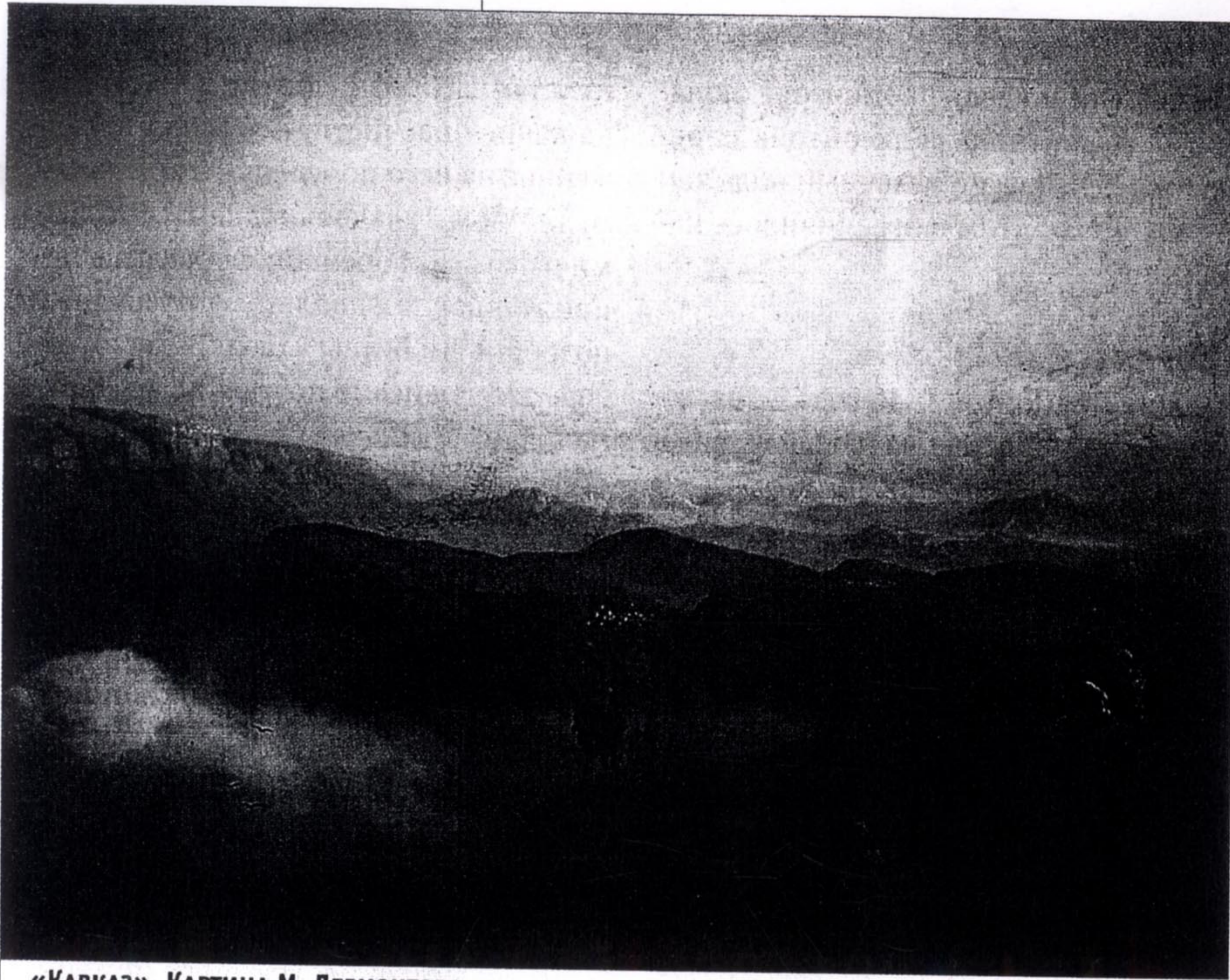
«КАВКАЗ». КАРТИНА М. ЛЕРМОНТОВА

себя в порядок: мылись в бане, отсыпались, поправляли одежду и амуницию, чистили оружие, точили сабли и штыки. И опять в боях у аула Аллы, в Гойтинском лесу и у реки Валерик Лермонтов показал себя опытным и хладнокровным командиром, которого отличали смелость и распорядительность в боевой обстановке. При разборе итогов похода он и в этот раз был отмечен генералом. С 9 по 20 ноября отряд находился в Малой Чечне. И на этот раз не было дня без боевых столкновений. В походе Михаил Юрьевич состоял при начальнике отряда офицером для поручений. Приказания командирам частей доставлялись быстро, несмотря на ураганный огонь противника.