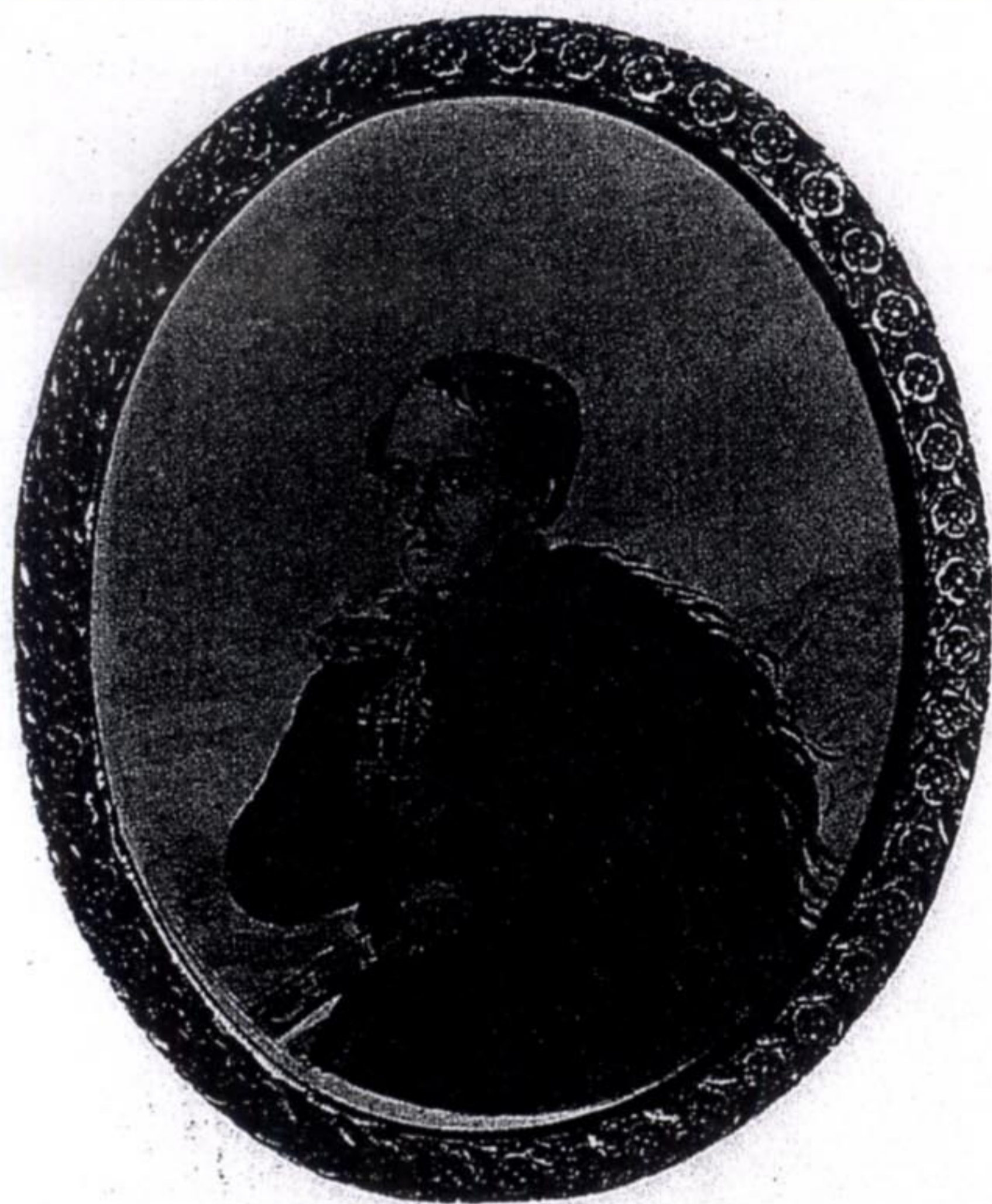
Автопортрет М. Лермонтова. Акварель. В 1837-1838 годах Михаил Юрьевич создаёт автопортрет. Он изобразил себя в мундире Нижегородского драгунского полка: в черкеске с газырями на груди, наброшенной на плечо бурке, с шашкой на поясе, на фоне гор. Это один из лучших и достовернейших портретов поэта

лучил царапину ниже локтя, и инцидент можно бы было считать исчерпанным. Но не тут-то было.