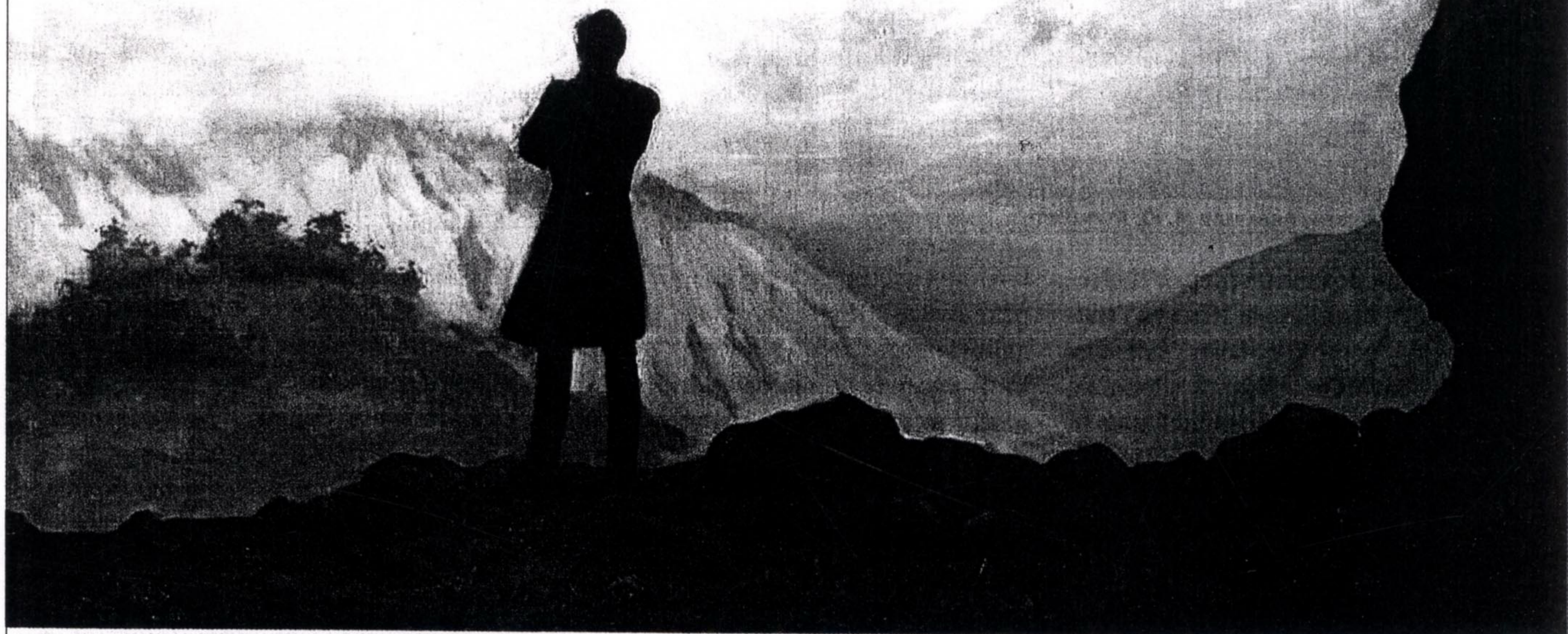
М. Решетнёв. "Лермонтов на Кавказе"